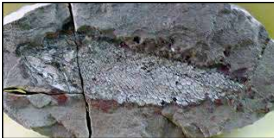
Figura 1. Osteolepis fósil.