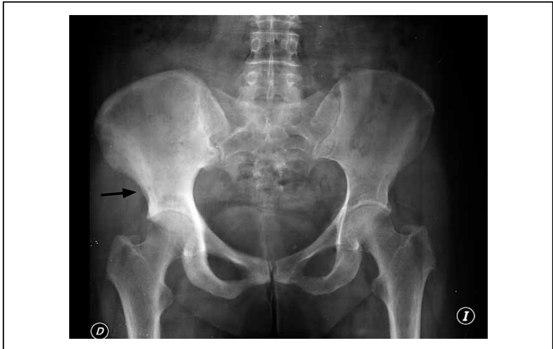
Figura 2. Radiografía de pelvis: hueso ilíaco derecho con radiopacidad difusa.

Enfermedad de Paget monostótica con afectación de hueso ilíaco derecho descubierta incidentalmente en una mujer de 67 años que realizó tomografía computarizada de abdomen y pelvis. Se observa importante esclerosis de hueso iliaco derecho, con marcada asimetría respecto del lado izquierdo. En la radiografía solicitada posteriormente se observa radiopacidad difusa en el hueso ilíaco característico de osteitis de Paget. Los valores de fosfatasa alcalina fueron elevados: 290U/L (rango normal: 200 U/L). En algunos casos con compromiso de la articulación sacroilíaca